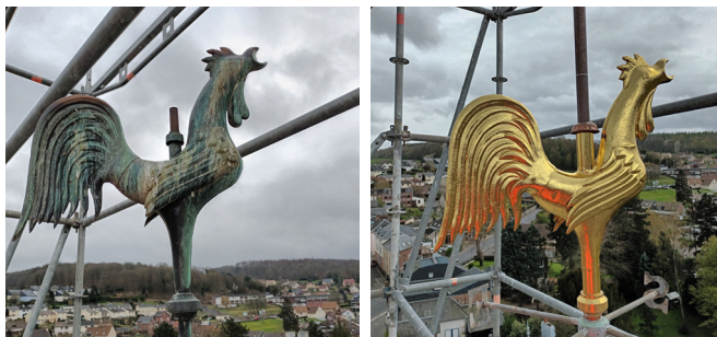
Le coq qui trône au sommet du clocher de l'église a été restauré. Un paratonnerre a également été installé et les cloches ont été révisées.