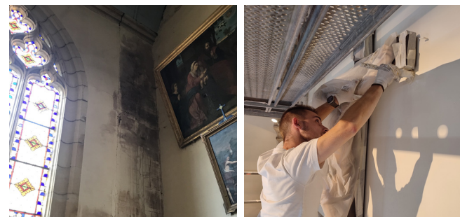
L'intérieur de l'église a été repeint et l'ensemble du réseau électrique, intégrant l'éclairage, le chauffage et la sonorisation a été remplacé.