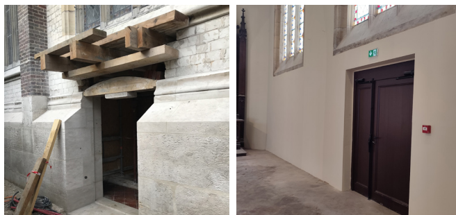
La création d'une issue de secours et la réalisation d'un accès pour personnes à mobilité réduite améliorent l'accessibilité et la sécurité de l'église.