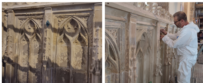
Des sculptures du chœur avaient subi des détériorations sous la poussée des sels en cristallisation suite à une fuite au niveau du chéneau. Un traitement a permis de stopper l'effet de l'humidité et de restaurer la pierre.