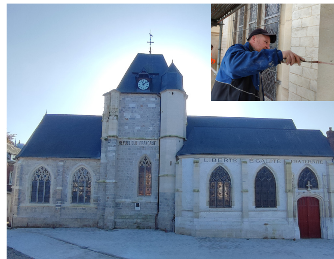
Les façades ont été nettoyées, les anomalies reprises et l'édifice a bénéficié d'un rejointoiement complet. Dans le cadre de l'opération de requalification du centre bourg, la Commune a intégré la réalisation d'un parvis et l'effacement des câbles électriques qui passaient devant la façade de l'église.