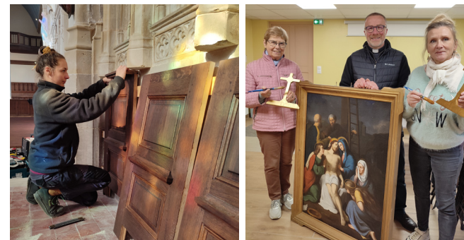
Les bancs ont été restaurés et des menuiseries du chœur ont été remplacées. Parallèlement à l'intervention des entreprises, des paroissiens se sont affairés au nettoyage et à la restauration du chemin de croix.