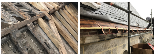
La toiture de la sacristie est entièrement neuve et l'ensemble de la couverture a été révisée. Les gouttières ont été remplacées et un réseau de drainage a été réalisé en périphérie du bâtiment pour l'évacuation des eaux pluviales afin d'assainir l'édifice.