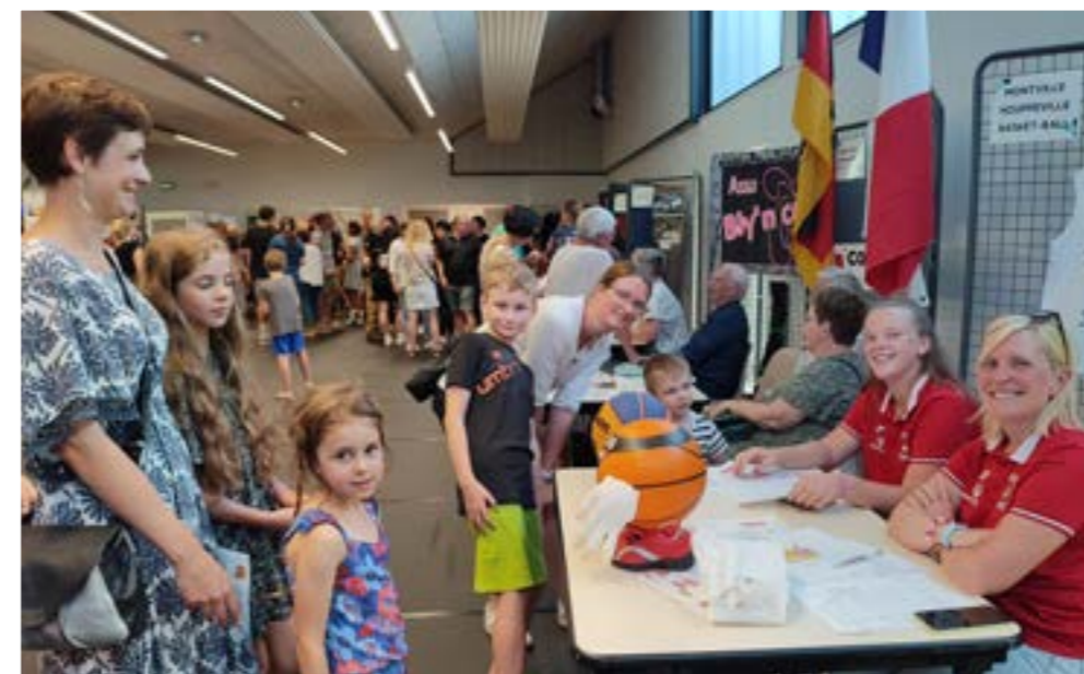
Le forum des associations trouve parfaitement sa place dans la nouvelle salle multi-activités Florian Merrien. En 2025, cette journée de promotion du monde associatif montvillais se déroulera dimanche 7 septembre.