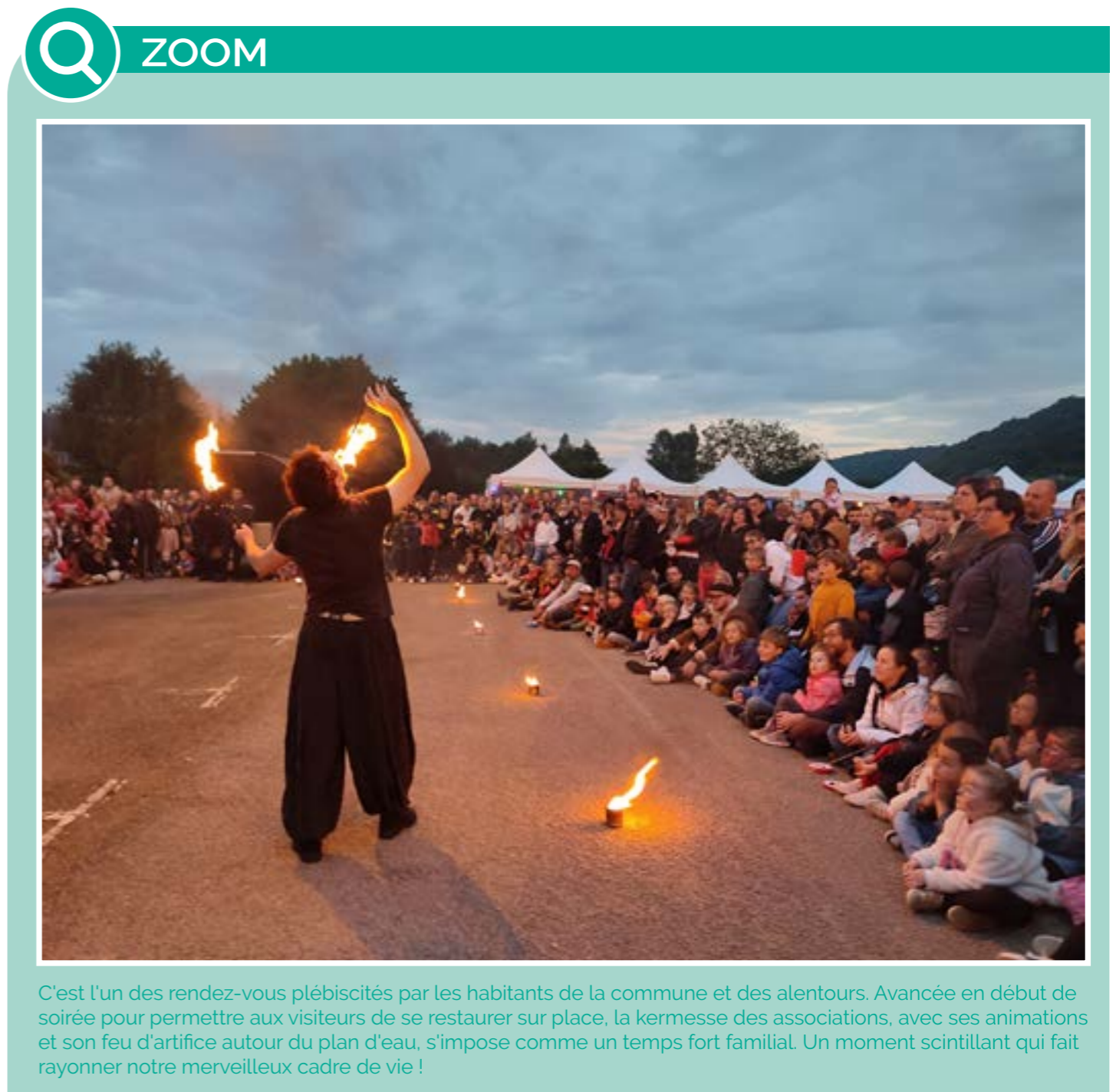
C'est l'un des rendez-vous plébiscités par les habitants de la commune et des alentours. Avancée en début de soirée pour permettre aux visiteurs de se restaurer sur place, la kermesse des associations, avec ses animations et son feu d'artifice autour du plan d'eau, s'impose comme un temps fort familial. Un moment scintillant qui fait rayonner notre merveilleux cadre de vie !