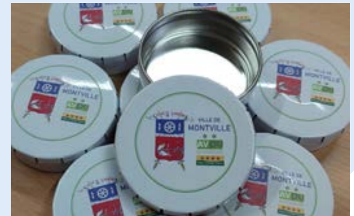
500 cendriers de poche ont été réalisés. Les fumeurs Montvillais sont invités à les retirer en mairie sur présentation d'un justificatif de domicile.

Pour lutter contre la présence dans l'environnement du troisième déchet le plus polluant, la Commune de Montville a réalisé des cendriers de poche. Depuis décembre, les fumeurs Montvillais sont invités à en retirer un exemplaire en mairie. Cette action est menée dans le cadre du label AVPU, Association des villes pour la propreté urbaine. Elle vise à éviter que les mégots de cigarettes ne terminent leur vie dans la nature. Il faut savoir qu'un seul de ces mégots se dégrade en microparticules qui mettent plusieurs années à se décomposer, polluant au passage plus de 500 litres d'eau.