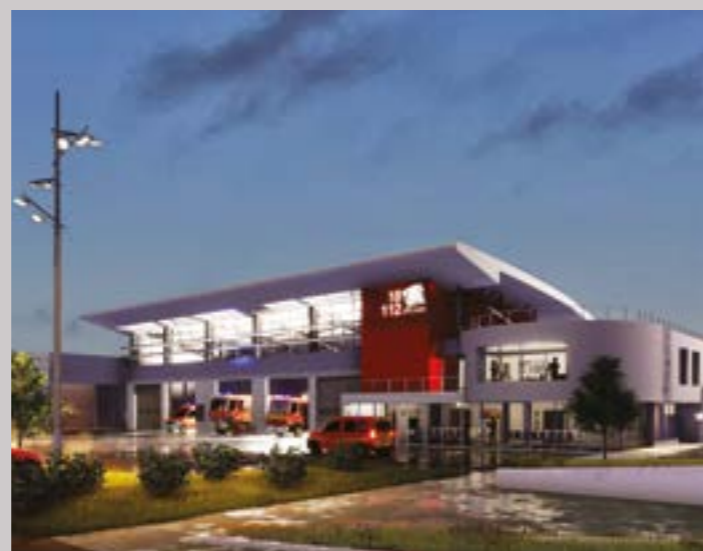
Le Centre d'incendie et de secours de la vallée du Cailly doit être opérationnel au printemps 2026.

La Commune de Montville a apporté son soutien à la réalisation de cette opération de plus de 4 millions d'euros. Elle a en effet offert le bâtiment principal et conduit la démolition de deux bâtiments annexes via l'Établissement public foncier de Normandie afin de mettre à disposition des pompiers, un espace d'évolution extérieure. La durée estimée du chantier est de dix-huit mois.