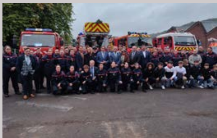
Les travaux du futur Centre d'incendie et de secours de la vallée du Cailly ont été officiellement lancés le 7 octobre.

Les travaux d'aménagement du futur Centre d'incendie et de secours de la Vallée du Cailly sont en cours depuis l'automne. Ce nouveau CIS regroupera les quatre-vingt-dix sapeurs-pompiers de Montville et Malaunay sur une partie de l'ancien site Legrand. Une première au niveau du département.