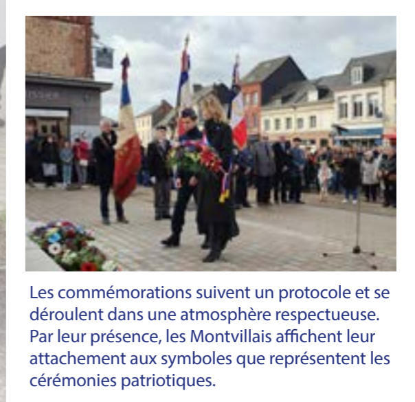
Symbole du passage de témoin, les jeunes sont fortement associés aux cérémonies patriotiques. Les anciens combattants confient par exemple la lecture de leur intervention aux Jeunes sapeurs-pompiers.